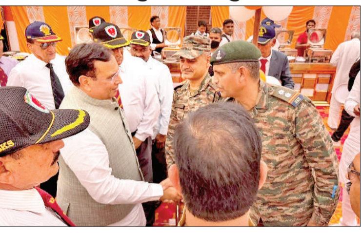
जींद। बधाना में आयोजित कार्यक्रम में शिरकत करते पूर्व वित्त मंत्री कैप्टन अभिमन्यु व बधाना में आयोजित कार्यक्रम में सैन्य अधिकारियों से मिलते पूर्व वित्त मंत्री कैप्टन अभिमन्यु।