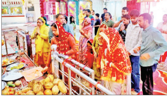
जीद। जयंती देवी मंदिर में मां भगवती की आरती करते श्रद्धालु व माता वैष्णवी धाम में नवार्ण महायज्ञ में आहुति डालने के बाद प्रवचन सुनते श्रद्धालु।