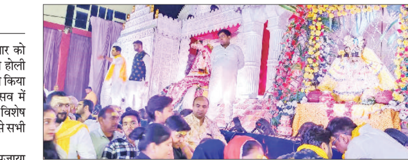
नरवाना। बाबा श्याम के समक्ष माथा टेकते हुए श्रद्धालु।