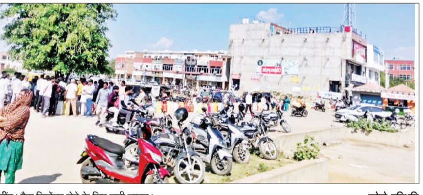
जींद। गैस सिलेंडर लेने के लिए लगी लाइन।

गैस सिलेंडर न मिलने से खफा उपभोक्ताओं ने सोमवार दोपहर बाद पुलिस कालोनी के सामने गोहाना रोड पर खाली सिलेंडर रख कर जाम लगा दिया। जाम लगने की सूचना पाकर सिविल लाइन थाना प्रभारी मौके पर पहुंचे और लोगों को समझा बुझा कर जाम खुलवाया। हुडा ग्राउंड में रसीद गैस सिलेंडरों का इंतजार कर रहे उपभोक्ताओं का सोमवार दोपहर बाद उस समय गुस्सा फूट पड़ा जब तीसरे दिन भी गैस की स्पलाई नहीं मिली। खफा उपभोक्ता खाली सिलेंडर लेकर पुलिस कालोनी के सामने जींद-गोहाना रोड पर आ गए और खाली सिलेंडर रख जाम लगा दिया। पारस गैस उपभोक्ताओं ने कहा कि वह पिछले तीन दिन से गैस सिलेंडर के लिए लाइन में लग रहे हैं लेकिन स्पलाई न आने की बात कह कर उन्हें चलाता कर दिया जाता है। अगर स्पलाई नहीं आती तो पच्ची क्यों काटी जा रही है।