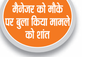
एजेंसी मैनेजर को मौके पर बुला किया मामले को शांत

सिविल लाइन थाना प्रभारी ने समझाकर जाम खुलवाया