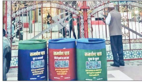
कैथल। सांसद नवीन जिन्दल द्वारा रखवाए गए समर्पण पात्र।

सांसद नवीन जिन्दल द्वारा धार्मिक आस्था और पर्यावरण संरक्षण को एक साथ जोड़ते हुए एक सराहनीय पहल की गई है। नवीन जिन्दल फाउंडेशन के माध्यम से जिले के छः मंदिरों में तीन-तीन समर्पण पात्र उपलब्ध कराए गए हैं, जिनका उद्देश्य पूजा के बाद निकलने वाली सामग्री को अलग-अलग एकत्रित करना है। यह सभी समर्पण पात्र हल्का कैथल के माता गेट स्थित काली माता मंदिर व शरावाली