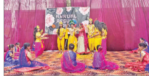
उद्याना। वार्षिकोत्सव में प्रस्तुति देते हुए विद्यार्थी।