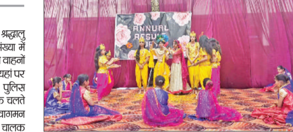
उद्याना। वार्षिकोत्सव में प्रस्तुति देते हुए विद्यार्थी।